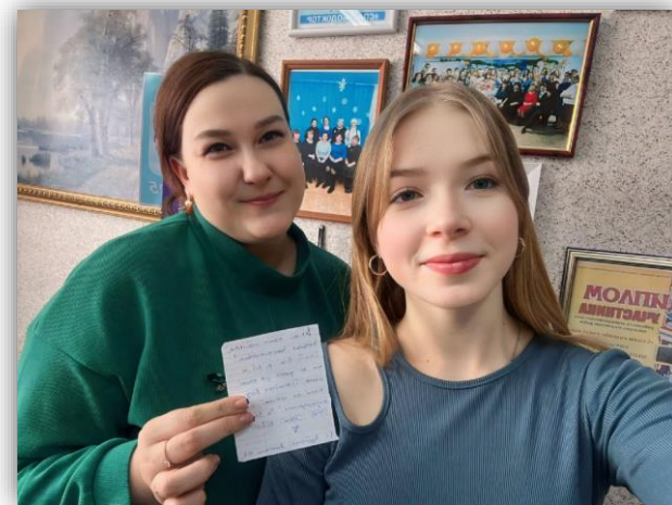
Киренский район Акция «Почта доброты»