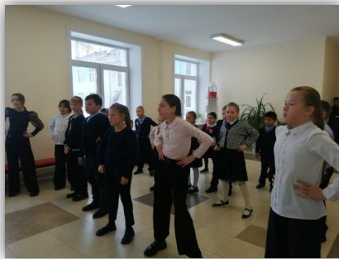
Иркутский район Акция «Фитнес переменка»