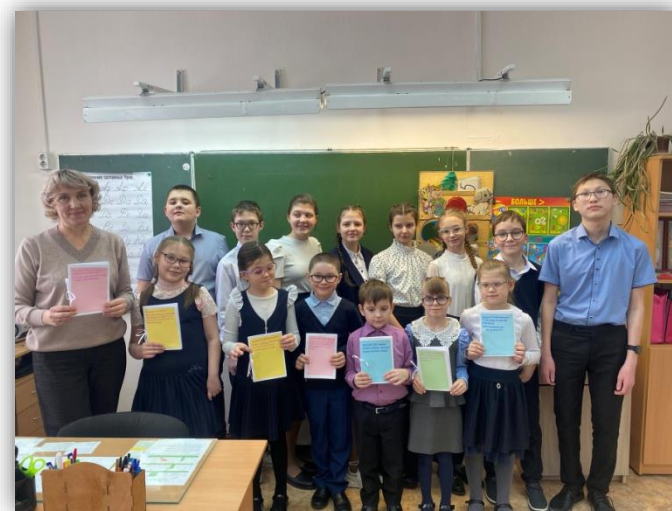
ГОКУ «Школа-интернат №8» г. Иркутска