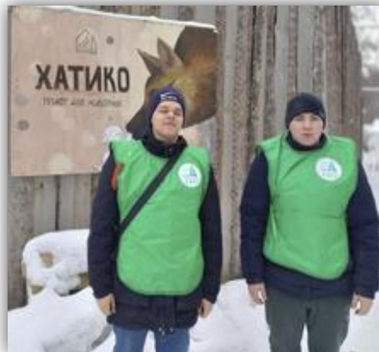
ГБПОУ ИО «Усть – Илимский техникум лесопромышленных технологий и сферы услуг»