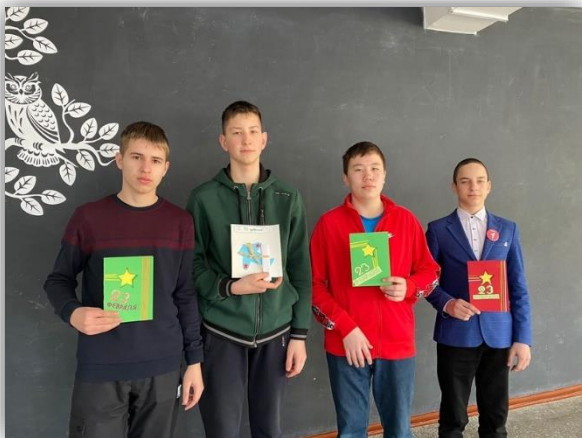
Усольский район Акция «Открытка солдату»