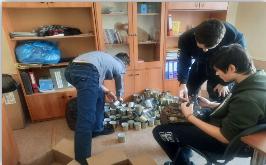
ГОКУ ИО «Специальная (коррекционная) школа-интернат № 19 г. Тайшета»